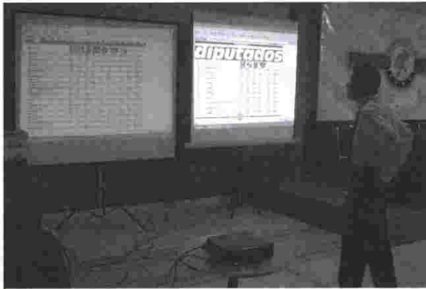
PREP: el sistema en operación