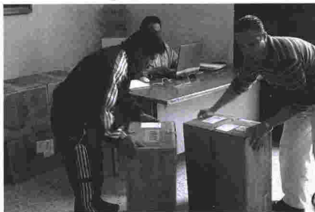
Equipamiento de Consejos Electorales para un buen desempeño del PIJE

Para que el programa operara con regularidad se instaló en todo el territorio del Estado un sistema de radiocomunicación de la siguiente manera: