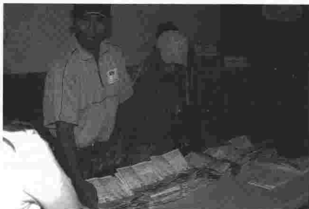
El cómputo de votos en proceso